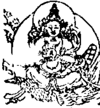
ॐ अमृताय नमः 月光天子