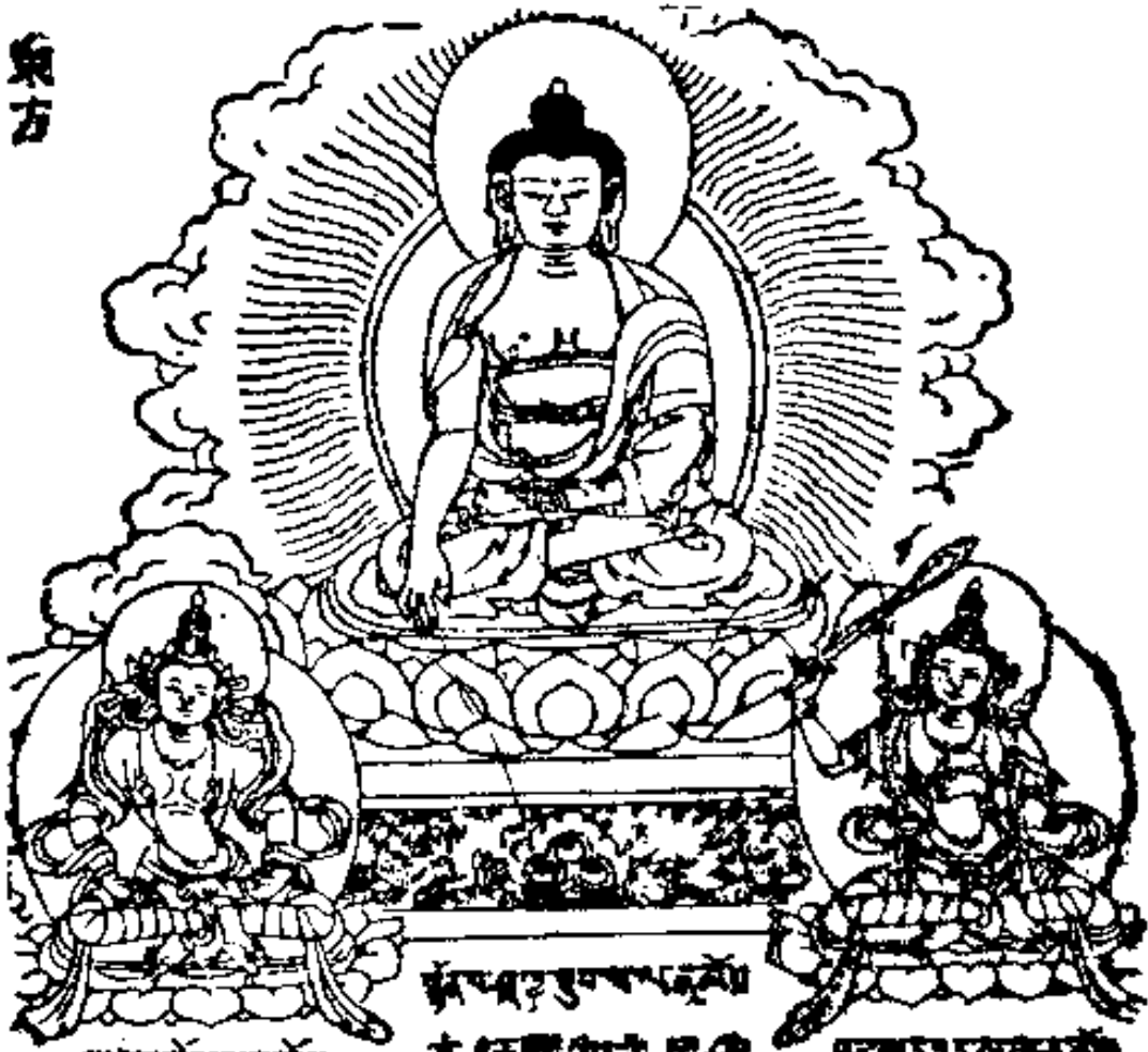
釋迦牟尼佛 救脫菩薩