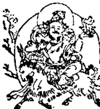
अग्निदेवता । 火天