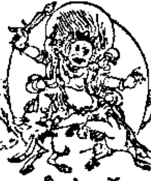
व्योमदेवता । 閻魔天