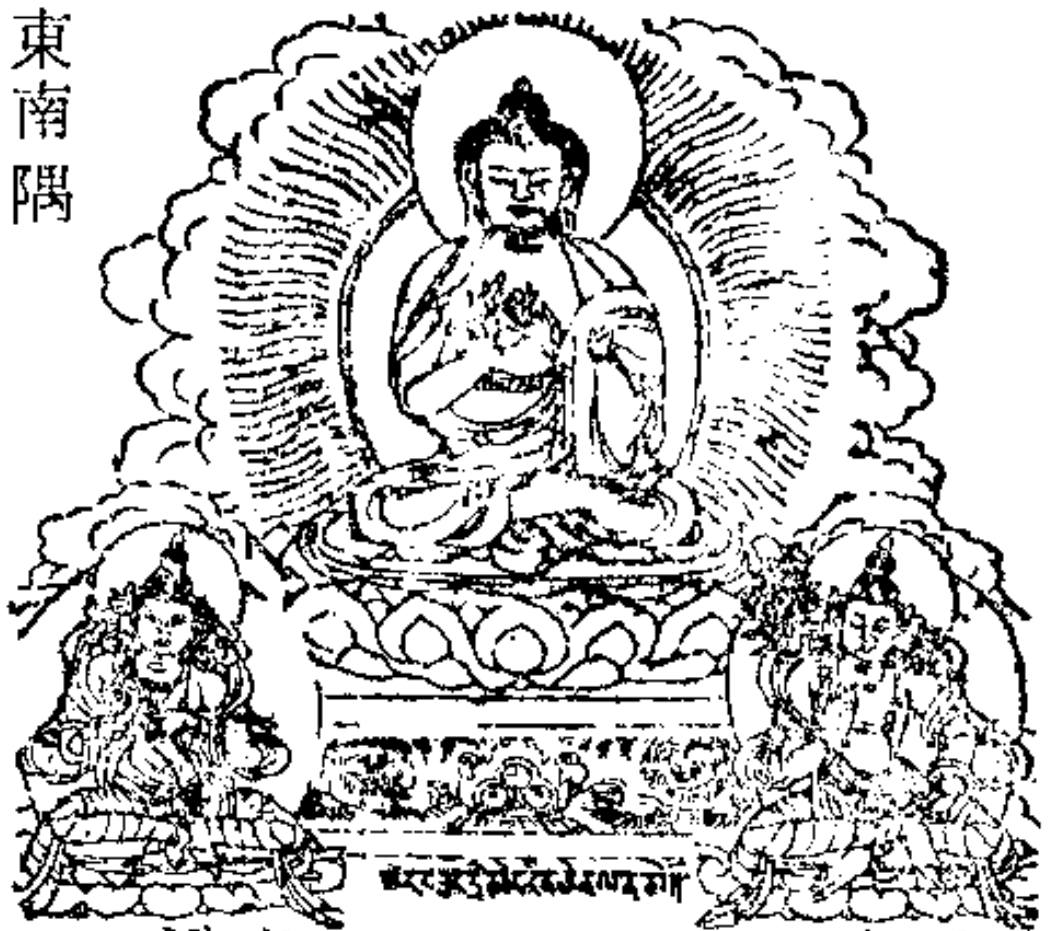
ॐ अमृताय नमः 金剛手菩薩