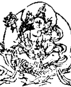
ॐ अमृताय नमः 梵天