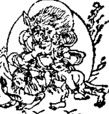
पृथ्वीदेवता । 囉叉天