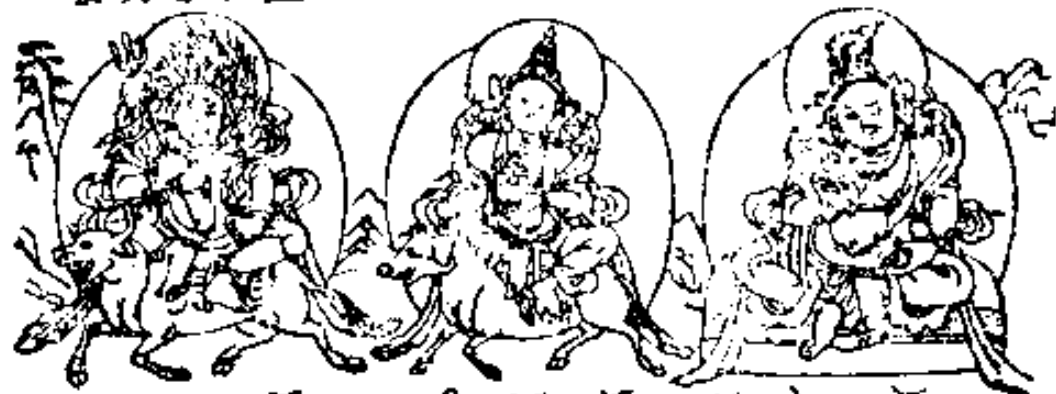
མུལ་པ་ཐོ་མཁའ་མཁའ་མོ། 自在天