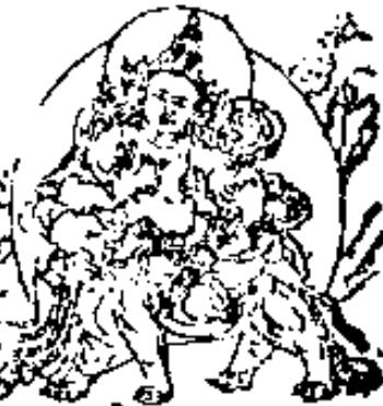
ॐ अमृताय नमः 帝釋天