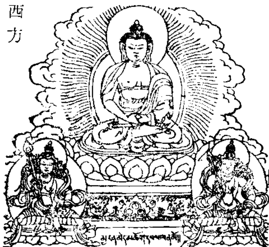
མུལ་པ་ཐོ་མཁའ་མཁའ་མོ། 破冥慧菩薩