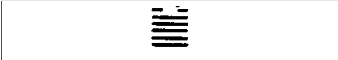
至等覺之乾慧如乾卦